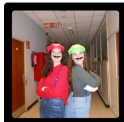
Halloween à l'école !