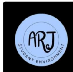
Compte des Rhétos !