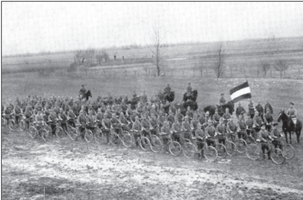
Chasseurs cyclistes français, 1914