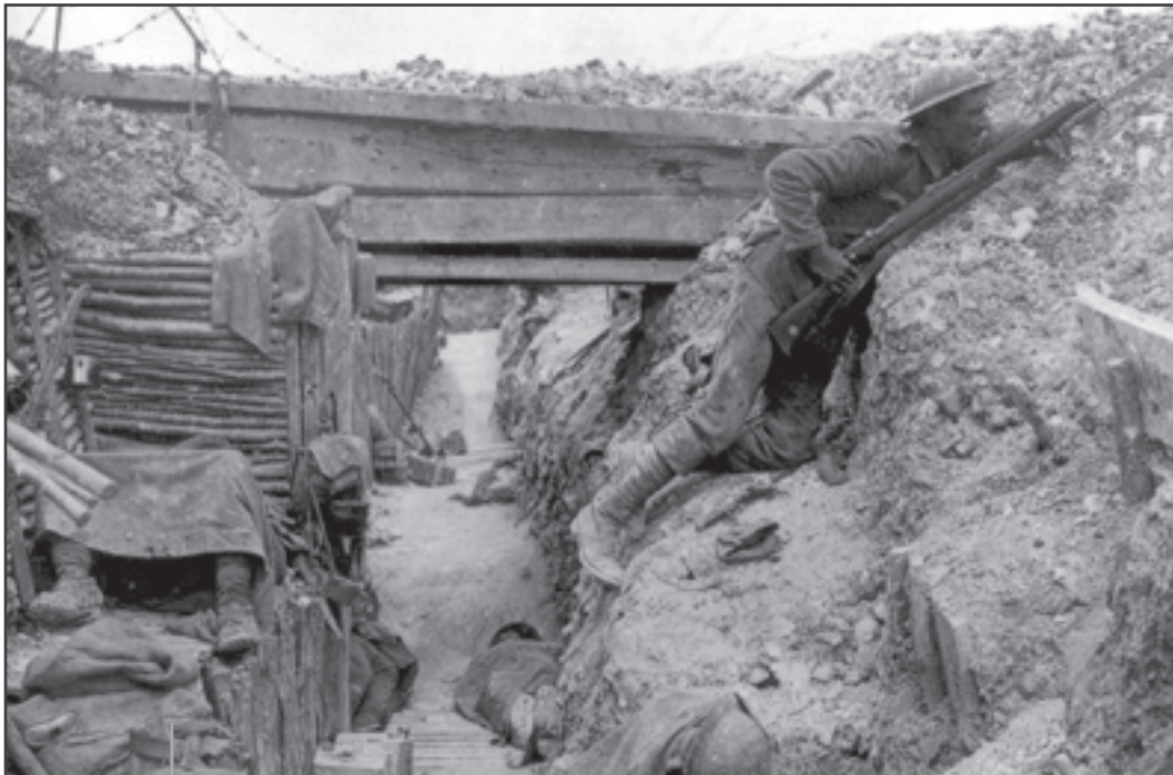
Soldats français, Verdun 1916