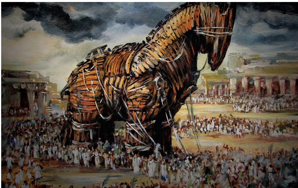
Le cheval de Troie