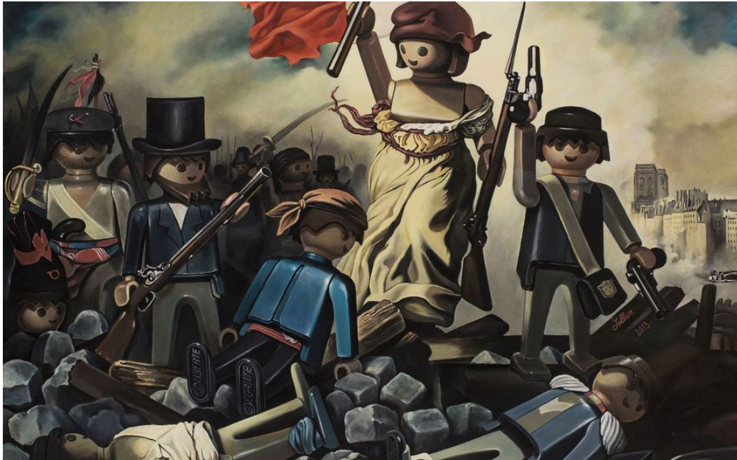
La liberté guidant le peuple – Eugène Delacroix détourné par Pierre-Adrien Sollier

Regarde attentivement les tableaux suivants.